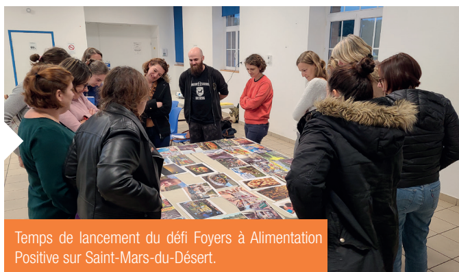
Temps de lancement du défi Foyers à Alimentation Positive sur Saint-Mars-du-Désert.