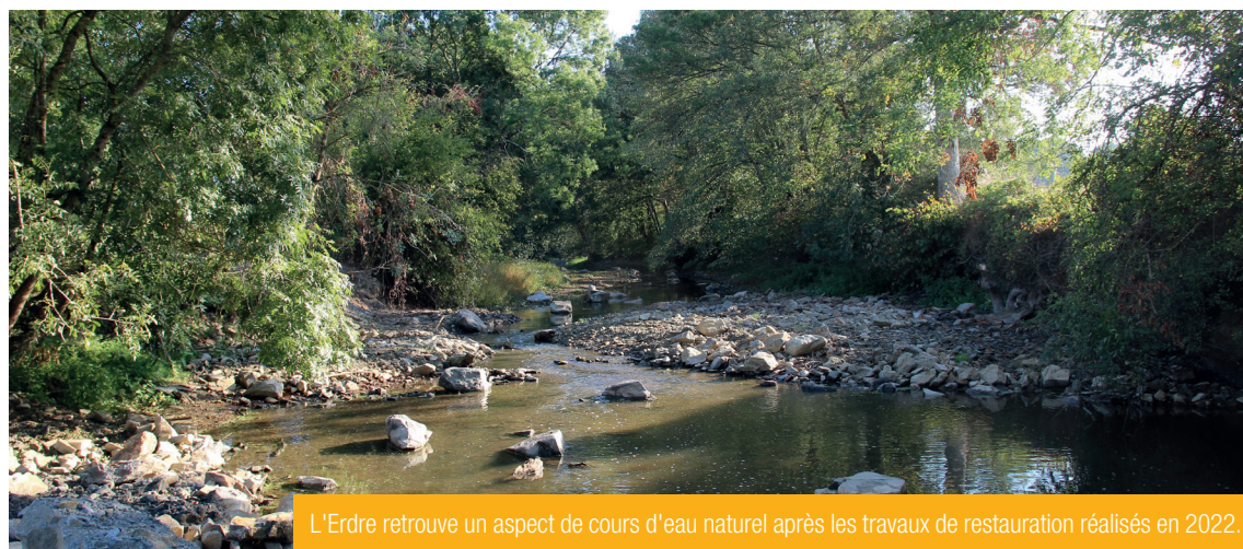
L'Erdre retrouve un aspect de cours d'eau naturel après les travaux de restauration réalisés en 2022.

Pour préserver nos cours d'eau et améliorer la vie et le déplacement des poissons, notamment des espèces migratrices et le transit des sédiments, des travaux de restauration dits, de la continuité écologique, sont nécessaires sur certains ouvrages. Après l'aménagement de 2 ouvrages en 2021, des travaux permettant de retrouver un état de fonctionnement plus naturel de l'Erdre ont été réalisés en 2022. Ainsi, près de 11 000 tonnes de cailloux de différentes tailles ont été placés dans le cours d'eau afin de remonter la nappe d'eau et de resserrer les écoulements de l'Erdre lors des faibles débits. Parmi les soins à apporter également aux cours d'eau, figure aussi l'arrachage de la jussie et autres espèces exotiques envahissantes. L'an passé, 2,68 tonnes de ces plantes nuisibles ont été arrachées. Pour mener à bien toutes ses actions en faveur des milieux aquatiques du territoire, la communauté de communes a préparé l'instauration de la taxe GEMAPI pour la Gestion des Milieux Aquatiques et de Prévention des Inondations (mise en place au 1er janvier 2023). Elle a par ailleurs renouvelé, la convention-cadre avec Polleniz pour 5 ans afin de lutter contre les rongeurs aquatiques envahissants que sont le ragondin et le rat musqué.