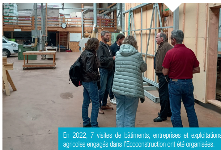
En 2022, 7 visites de bâtiments, entreprises et exploitations agricoles engagés dans l'Ecoconstruction ont été organisées.