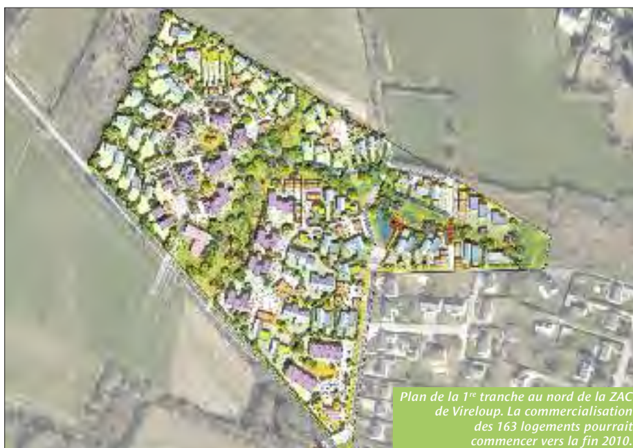
Plan de la 1 re tranche au nord de la ZAC de Vireloup. La commercialisation des 163 logements pourrait commencer vers la fin 2010.

Pour réussir à créer un nouveau quartier à vivre, le cabinet In Situ distingue trois espaces à investir. Les lieux domestiques intimes (logements), les lieux publics (espaces communs) et les lieux d'entre-deux (espaces de rencontre, de voisinage, de relation). Cet entre-deux sera travaillé avec beaucoup d'attention car un quartier prend vie quand les résidents se croisent, échangent, se rencontrent, mais aussi quand on leur laisse des petits lieux, des sentiers pour s'évader, observer, courir, se retrouver... À la question d'un habitant sur la circulation au sein du quartier, Pierrick Beillevaire a précisé que « l'automobile sera certes tolérée, mais elle ne sera pas prioritaire. On y roulera doucement grâce à une voirie volontairement tortueuse pour apaiser la vitesse. Les liai-