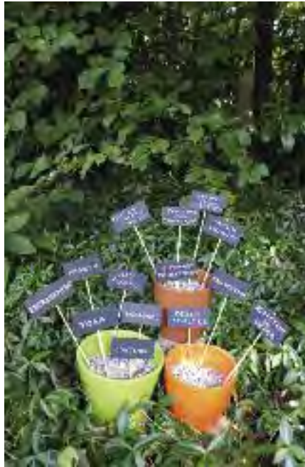
Exposition des arts créatifs le samedi 6 mars de 10 à 18 heures et le dimanche 7 mars de 10 à 17 heures, salle Simone-de-Beauvoir. Entrée libre.

Le week-end du 6 et 7 mars prochain, la salle Simone-de-Beauvoir accueillera les réalisations des adhérents de Treillières Accueil qui ont choisi les activités proposées dans le domaine de l'art, l'artisanat et les loisirs créatifs. Dessinateurs en herbe ou confirmés, peintres sur porcelaine, créateurs de vêtements, de vitrines, bijoux en pâte fimo, artistes en art floral, encadrement, broderie et réfection de sièges proposeront leurs œuvres autour d'un thème axé sur les couleurs orange, vert et marron. Venez nombreux nous rejoindre à cette exposition qui sera un moment d'échange au cours duquel les animateurs seront présents et pourront répondre à vos questions. Ce sera aussi l'occasion de découvrir la créativité de nos adhérents, pour la plupart Treilliérains.