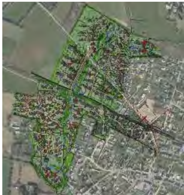
L'urbanisation de la ZAC de Vireloup d'une surface de 23 hectares prévoit la construction d'environ 500 logements sur 8 à 10 ans.

Plus de 150 personnes ont assisté, lundi 18 janvier dernier, à la présentation publique de l'aménagement de la ZAC de Vireloup, un nouveau quartier du bourg, qui s'inscrit dans une stratégie de continuité urbaine et d'offre de logements pour notre commune.