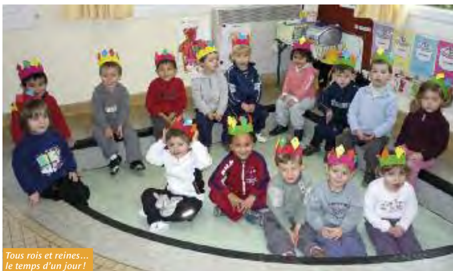
Tous rois et reines... le temps d'un jour !

Les enfants de La Passerelle ont apporté du jus d'oranges et tout le monde s'est régalé au cours du goûter. Avant la fin de l'année scolaire, les enfants de La Passerelle auront l'occasion de venir encore à l'école maternelle.